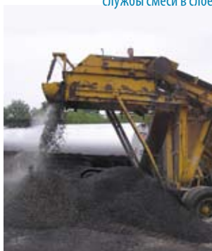
Заготовка холодной смеси на простейшем смесителе