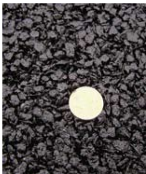
Толстая пленка вяжущего обеспечивает длительный срок службы смеси в слое