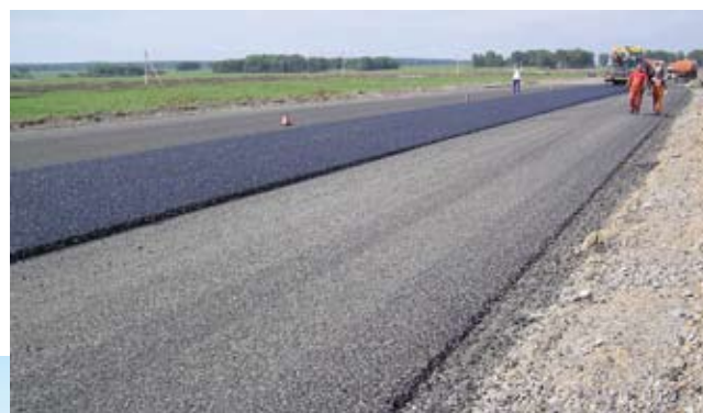
Новосибирская область. Реконструкция дороги с применением холодной смеси

и начался он с регионов: Самара, Новосибирск, Оренбург, Ульяновск, Калининград. В зимнем сезоне 2005-2006 гг. холодные смеси для ямочного ремонта опробованы вокруг Москвы. Это магистрали М3, М4, М7. На территории Белоруссии опытный проект осуществляется на магистрали М1. Холодные смеси являются наиболее простым способом реализовать преимущества технологии Мульти-