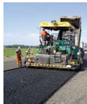
Этапы реконструкции в целом аналогичны стадиям работы с горячими смесями