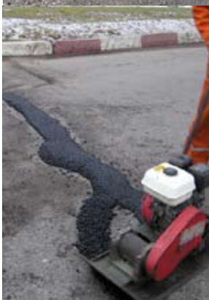
При уплотнении МАК-смеси используется обычная виброплита

отсутствует лишь жесткое ограничение на время укладки, уплотнения и температуру доставленной смеси, которое существует в горячей технологии из-за вероятности быстрого охлаждения смеси и невозможности ее качественного уплотнения.