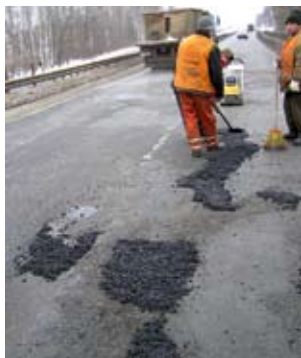
Магистраль М7. Зимний ямочный ремонт

Несмотря на применение современных материалов и технологий при строительстве и реконструкции дорог, проблема появления дефектов покрытия, и как следствие потребность в современных эффективных технологиях ямочного ремонта, продолжает оставаться актуальной. Возможность осуществления качественного ямочного ремонта простыми доступными средствами в течение всего года, включая позднюю осень, зиму и раннюю весну, несомненно, позволила бы избежать иногда просто катастрофических последствий ранней весной, когда по старой традиции обычно и начинаются массовые ремонтные работы на покрытии.