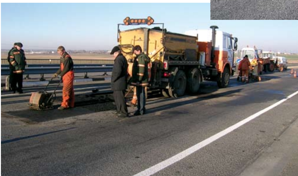
Магистраль М1. Белоруссия. Ремонт картами. Машина с дозированной выгрузкой холодной смеси

тигрейд, сделать первый шаг, результаты которого можно почувствовать уже в течение первого года. Однако с коммерческой точки зрения неопределимые преимущества перед конкурентами приобретут именно те, кто сумеет реализовать в России достоинства горячих смесей Мультигрейд, а это опыт строительства и ремонта ежегодно, только в США, более 1600 км