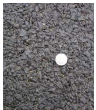
Первое время заплатка напоминает поверхностную обработку

Интересен опыт фирмы «Фэцит» по применению холодных МАК-смесей для реконструкции дорог местного значения. В Новосибирской области на опытном двухкилометровом участке, удаленном от ближайшего стационарного АБЗ на 100 км, было уложено двухслойное покрытие из холодных смесей различного зернового состава. Этапы реконструкции в целом аналогичны стадиям работы с горячими смесями,