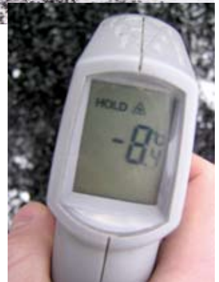
Работы можно осуществлять по влажной поверхности, при температуре самой смеси до -8^{\circ}\text{C}

вой компенсируется большим удобством выполнения работ и экономичностью самих ремонтных работ, так как не требуется специального оборудования и дорогостоящих подготовительных работ на выбранном участке, а также специальной подготовки самой смеси.