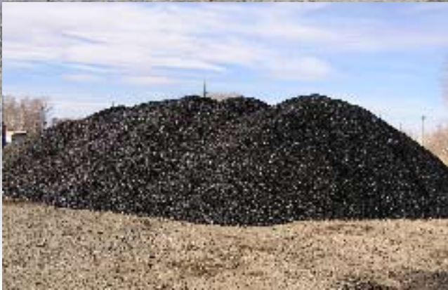
Холодные МАК-смеси могут складироваться под открытым небом, воздействие на окружающую среду отсутствует

ка объекта участка дефекта с удалением трещиноватых остатков старого покрытия гарантирует более длительный срок службы. Холодные МАК-смеси смеси гораздо менее требовательны к условиям применения и огрехам в подготовке выбоин. Даже в теплое осеннее и весеннее время такие смеси экономически конкурируют с вариантом выполнения ремонта горячими смесями.