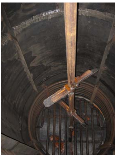
Вертикальная 3-х лопастная мешалка