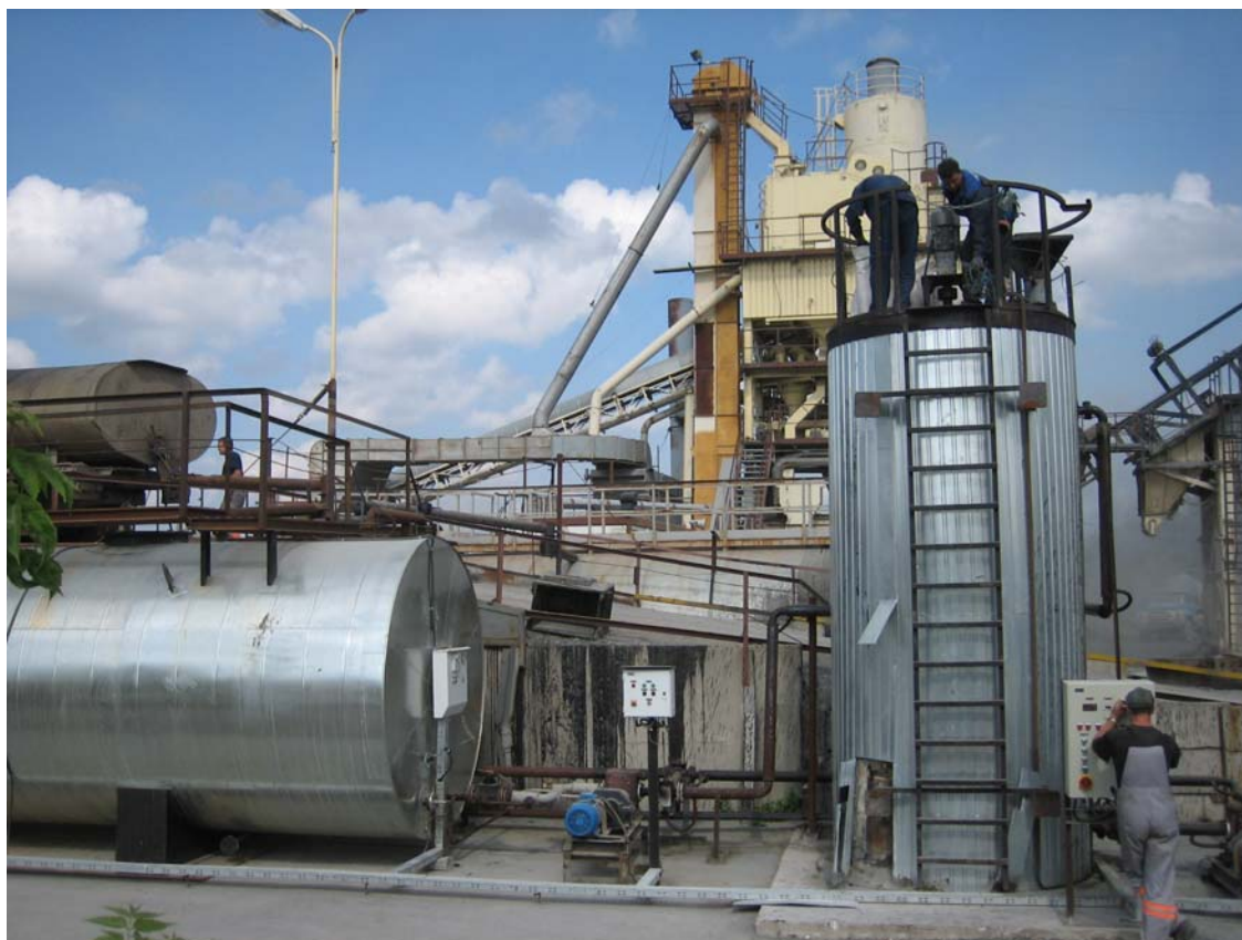
Вертикальная емкость-смеситель (на верхнем фото справа) для приготовления МАК-битума. (Слева - горизонтальная емкость подготовки/подогрева исходного битума.)

Для вертикальной емкости см. фото и рис. 1, в вертикальной емкости легче организовать перемешивание. Возможная схема перемешивания для горизонтальной емкости с длиной не более 7 метров представлена на рис. 2.