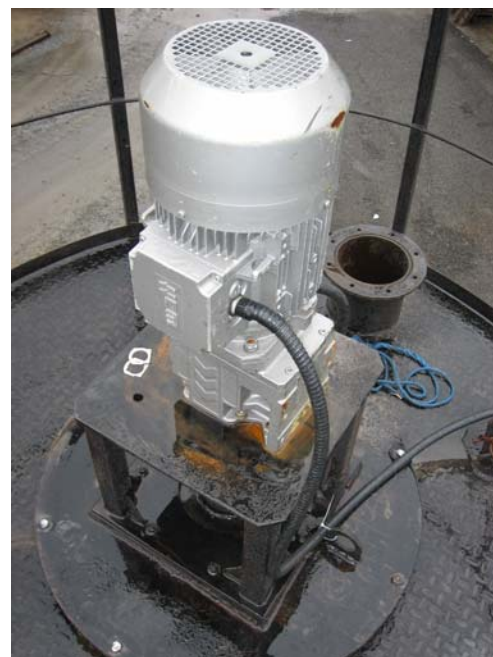
Мотор-редуктор привода мешалки (155об/мин).